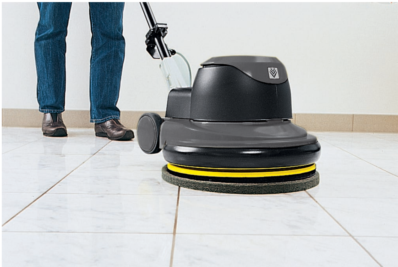
BDP 43/410 C